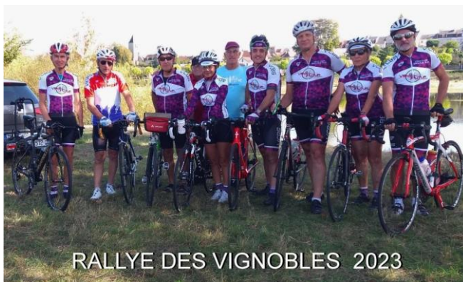
RALLYE DES VIGNOBLES 2023

En début d'année, j'avais évoqué pour la sortie club 2023, l'idée de participer au 44 ème Rallye de Vignobles organisé par le club de Cosne-Cours sur Loire, idée retenue, donc des parcours sur les secteurs viticoles de Sancerre et de Pouilly sur Loire. Sortie club en dehors de nos terres habituelles certes, en tous cas, pas « Voyage en terres inconnues ! »